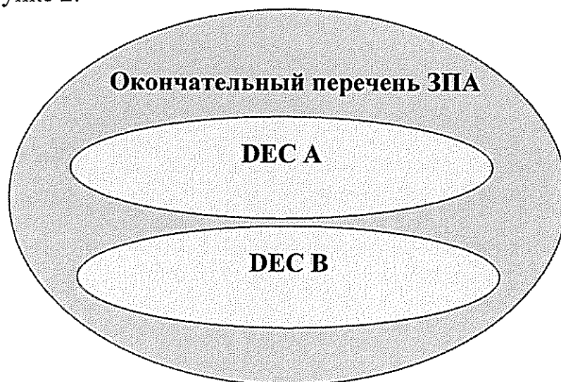
Рисунок 2. Соотношение аварийных сценариев, включаемых в окончательный перечень ЗПА (формируемый в соответствии с «Общими положениями обеспечения безопасности атомных станций») с запроектными условиями DEC A и DEC B (определяемыми в соответствии с подходами WENRA и EUR).

Схематично соотношение набора аварийных сценариев, включаемых в окончательный перечень ЗПА, формируемый в соответствии с федеральными нормами и правилами в области использования атомной энергии «Общие положения обеспечения безопасности атомных станций», с запроектными условиями, определяемыми в соответствии с подходами WENRA и EUR, показано на рисунке 2.